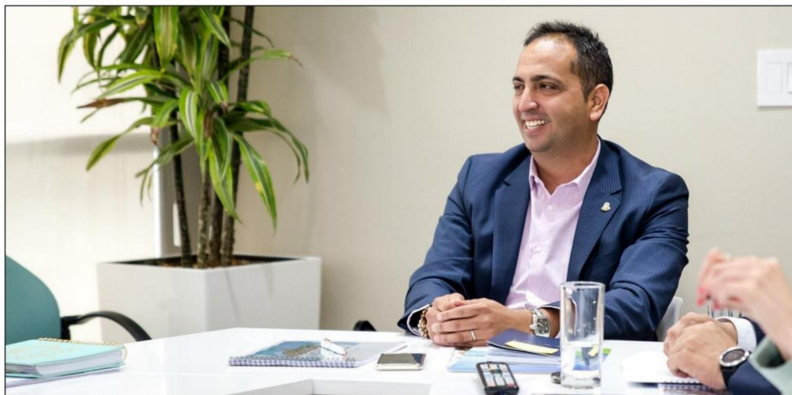
Minister Dangui Oduber a ricibi presentacion di e Corporate Plan y Budget 2019 di ATA. Importante den esaki ta cu e maneho di Minister di Turismo ta wordo refleha.